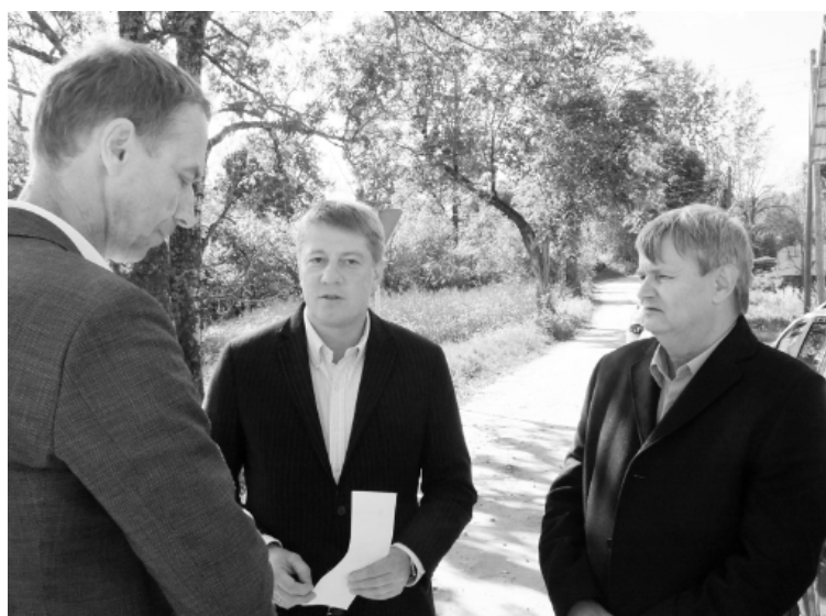
Pašvaldības pārstāvji ar ministru pārrunāja arī pilsētas tranzīta ielu rekonstrukcijas iespējas nākotnē

Alūksnes novada domes priekšsēdētājs, savukārt, informēja satiksmes ministru, ka ir ļoti svarīgi sakārtot tos ceļa posmus, kuri atrodas tieši pierobežā, lai iedzīvotāji vēlētus palikt dzīvot šajos reģionos. Alūksnes novada domes