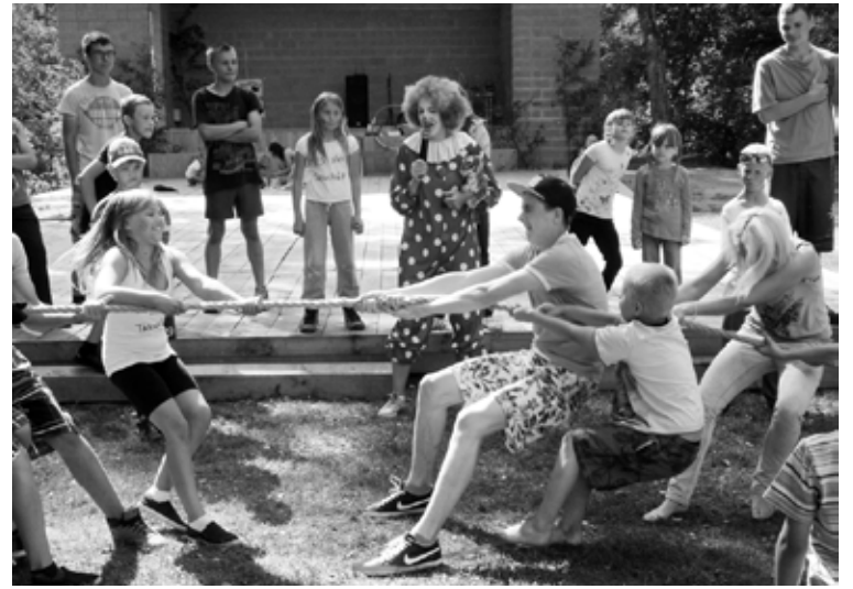
Jautrās stafetes aktīvās atpūtas dienā “Ejam, skrejām, smejam”

Sporta laukumā darbus veica firma SIA „RC AINAVA”. Projekta rezultātā ir izveidots volejbola laukums, izvietots basketbola grozs, gērbšanās kabīne, smilšu kaste bērniem un