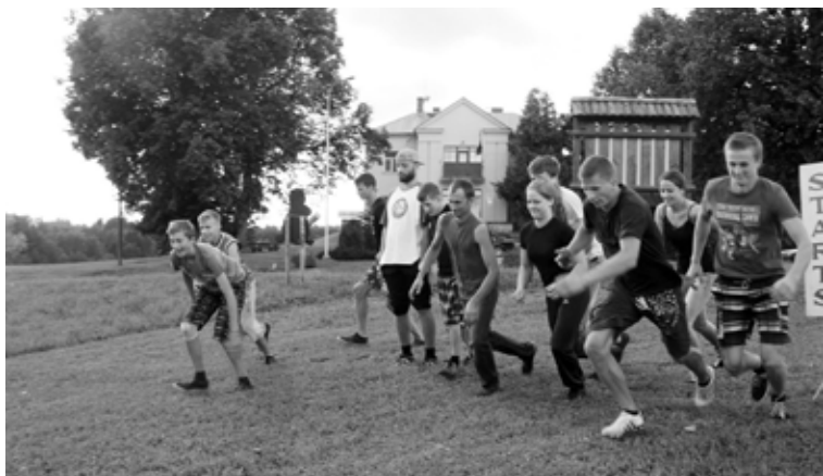
Veclaicene – Sporta diena Veclaicē kļuvis par ikgadēju tradīciju

Nu jau tradicionāli Veclaicenes pagastā augusta pēdējā sestdienā tiek rīkota sporta diena.