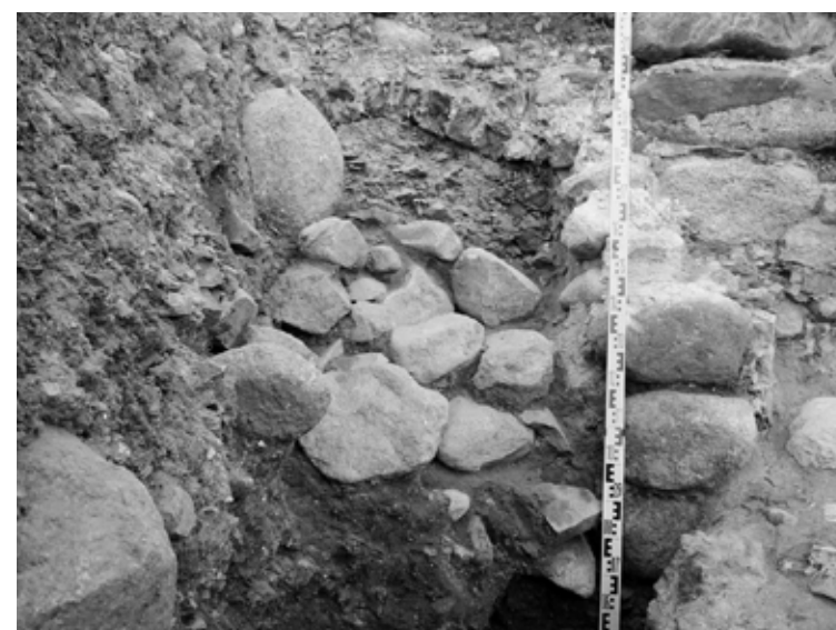
Ar laukakmeņiem un māliem aiztaisītā ieejas vieta (durvis) tornī tuvplānā

ekspozīcijas un skatu laukums torņa augšā. Lai saņemtu finansējumu būvprojekta izstrādei, pašvaldība ir sagatavojusi un Valsts Kultūras