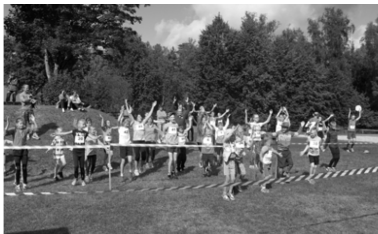
Pirms skriešanas vajag kopīgi iesildīties