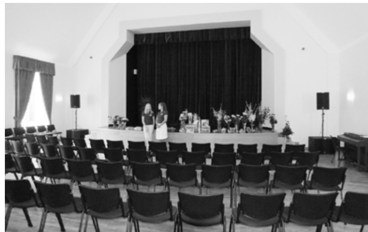
Diskusija noritēs Alūksnes Kultūras centra Mazajā zālē

Dalībai pasākumā jāpiesakās iepriekš, līdz 5. oktobrim sazinoties ar Alūksnes novada pašvaldības uzņēmējdarbības atbalsta