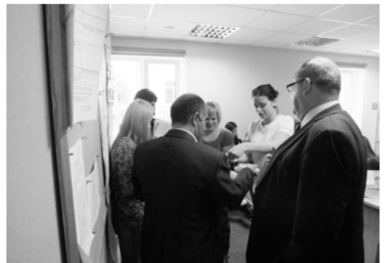
Viesus Alūksnes Bērnu un jauniešu centrā cienā ar pašgatavotiem gardumiem

Šo aktivitāšu rezultātā Moldovas Ziemeļu reģiona speciālisti ieguva specifisku informāciju par atsevišķām iniciatīvām atbilstoši viņu tematiskajām prioritātēm. Vadoties no šīs vizītes, viesi izstrādās plānu pieredzes iedzīvotājiem Moldovā, kas tiks aktualizēta Latvijas delegācijas vizītes laikā no šā gada 5. līdz 10. oktobrim.