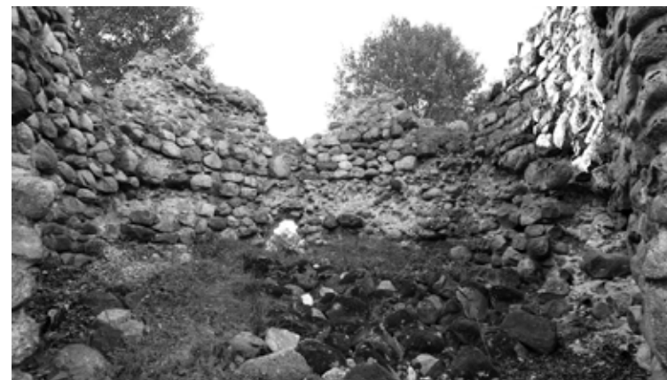
Skats uz torņa iekšpusi no pils pagalma puses pēc krūmu nociršanas un pirms izpētes darbu uzsākšanas

Arheologi darbu viduslaiku pils teritorijā turpināsies arī oktobrī. Pēc tam plānots atrakto laukumu iezīmēt. Šobrīd ir noslēdzies pašvaldības izsludinātais iepirkums par pils attīstības meta izstrādi un šo pasūtījumu veiks SIA "Arhitektoniskās izpētes grupa", ar ko jau noslēgts līgums. Mets tiks izstrādāts, pamatojoties uz vecajiem pils plāniem, zīmējumiem un arheoloģiskās izpētes materiāliem. Pašvaldība plāno izstrādāt arī būvprojektu Alūksnes pilsdrupu dienvidu torņa pārbūvei, kur varētu tikt ierīkotas nelielas